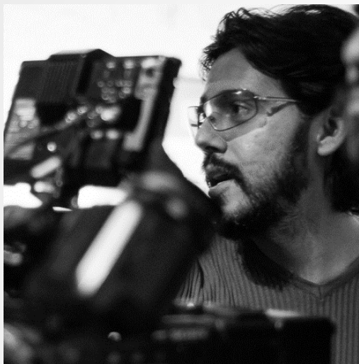
Director - Rocko D. Márquez

Con estudios en Comunicación por la UP-Guadalajara, ha escrito y dirigido una decena de cortos, entre los que destacan las ficciones POR AMOR/11, Y SIN EMBARGO, ES HERMOSA/12 (festivales de Oaxaca, Lucerne), TROPOS DE AÑORANZA/15 (Tequila), el corto documental LA LEYENDA DE JUAN BORRAYO/16 y el piloto de la serie documental POESÍA VIVA DEL MUNDO/16. Actualmente dirige el documental IMPOSTOR(es) , tiene en desarrollo la ficción LALA , ambos largos, y es miembro activo del Consejo Estatal para la Cultura y las Artes de Jalisco.